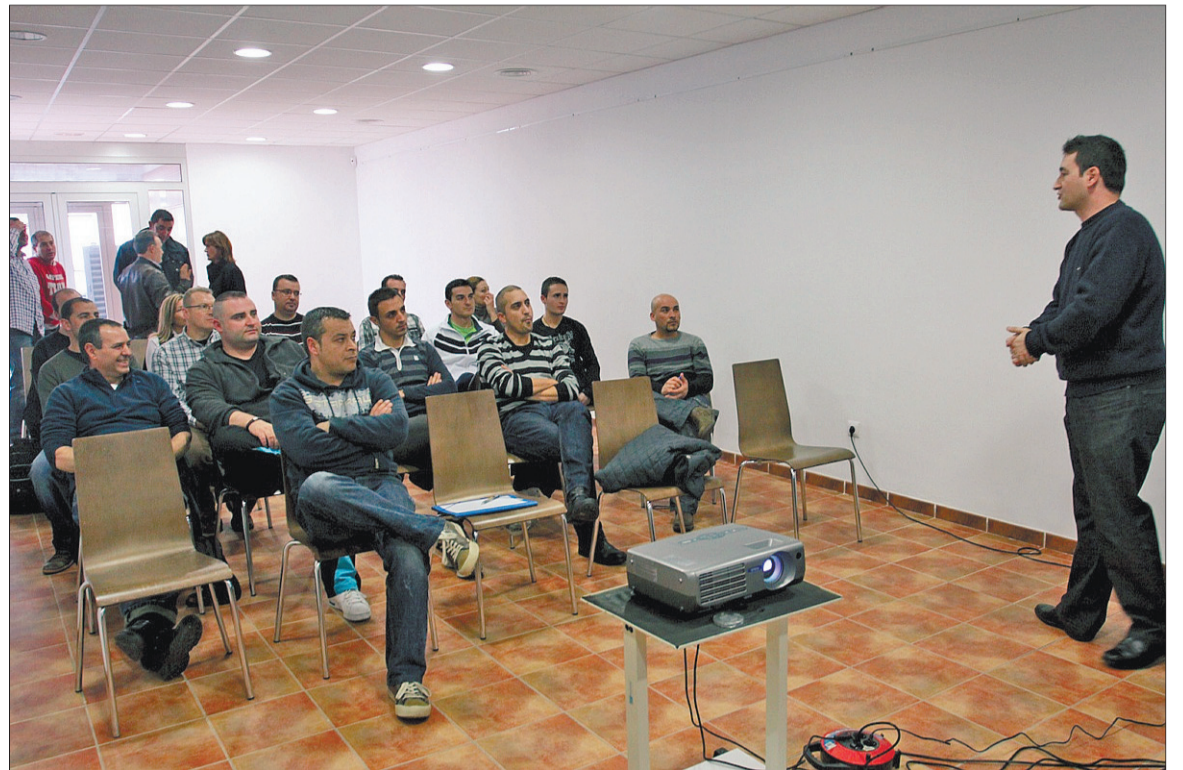
► Alguns dels assistents a la primera sessió d'ahir a la tarda.

Els empresaris de Constantí finançaran la construcció d'una nova rotonda d'accés al polígon. Aquesta permetrà reordenar el trànsit, serà elevada -en forma de diamant- i permetrà millorar els accessos. Aquesta tindrà un cost de sis milions d'euros i servirà per entrar directament a la zona industrial a més de l'aeroport.